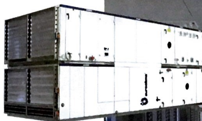
Unità di trattamento aria Euroclima con sistema adiabatico